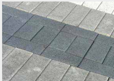
Производство на павета