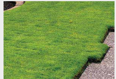
Почистване на тротоари и грижа за тревата