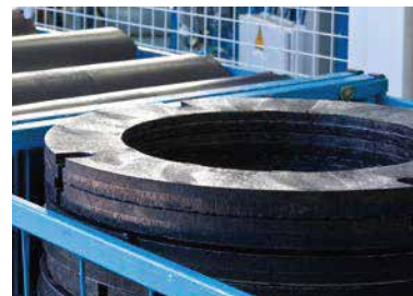
тяло на четката