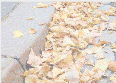
Почистване на пътища

За да допълним високото качество, разработваме идеалната система за всяко приложение, в кооперация с машинните и автомобилни производители.