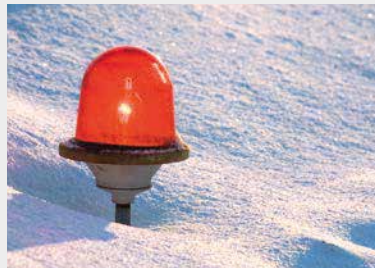
Почистване на сняг по летища