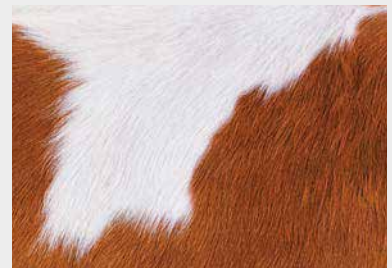
Грижа за добитък