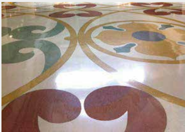
Почистване на индустриални и подови настилки